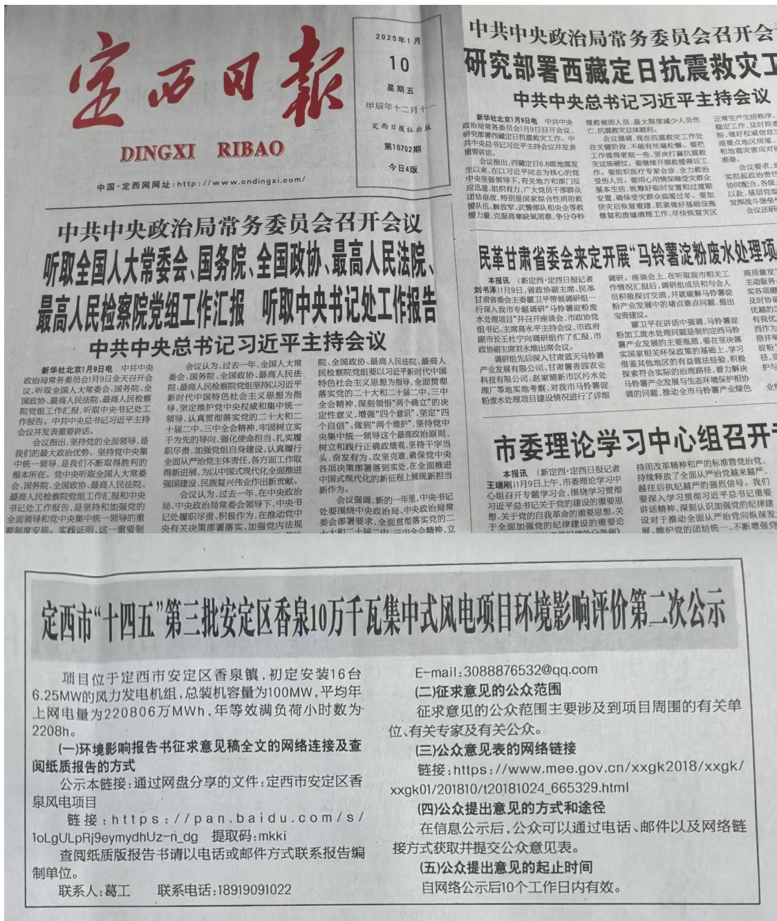
图3.2-2 (2) 2025年1月10日报纸公示截图