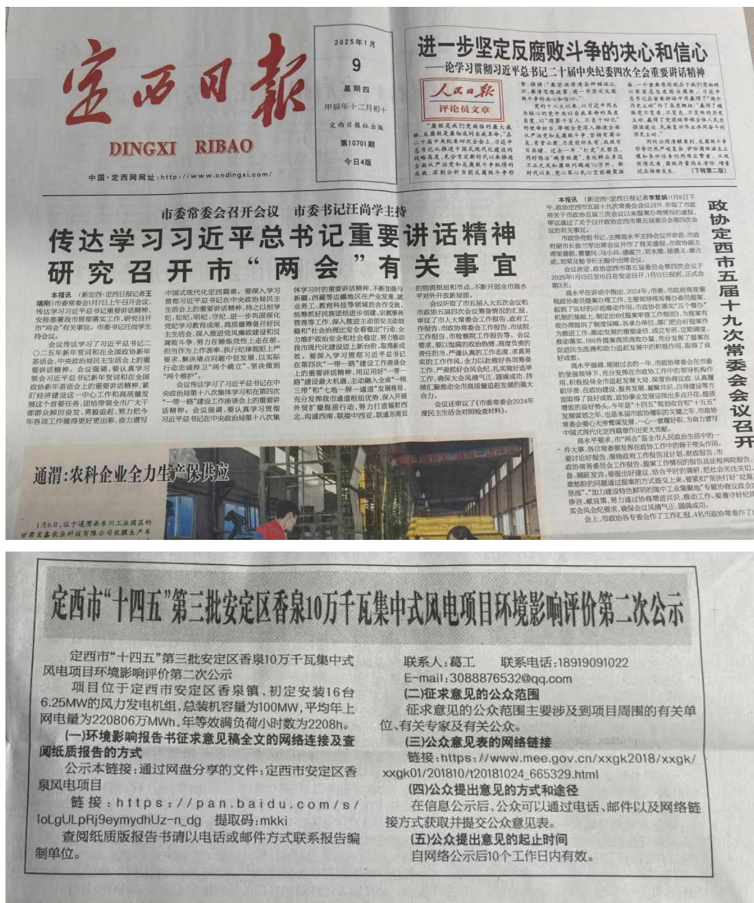
图 3.2-2 (1) 2025 年 1 月 9 日报纸公示截图

2025年1月7日-2025年1月21日，我单位在“定西日报”进行了项目环境影响报告书征求意见稿公开，符合公开载体的选取要求，报纸两次发布时间分别为2025年1月9日、2025年1月10日，报纸发布照片如下：