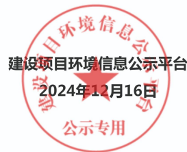
图1 项目第一次网络公示