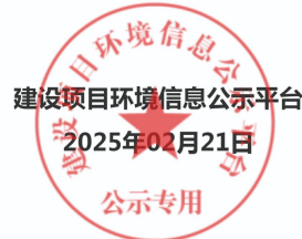
图 3.2-1 征求意见稿公示截图截图